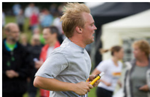
Foto fra DHL-stafetten. Nu er der også mulighed for at deltage i Kuul-running.

Tre ultraløbere har taget initiativ til KUUL running, hvor de løber sammen to gange om måneden og meget gerne vil have flere løbere med fra Århus Sygehus. KUUL running er motion og velgørenhed på samme tid.